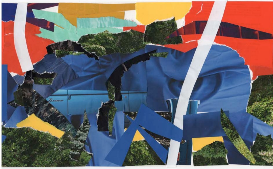
Afbeeldingen: (B) Franz Marc, De Blauwe Paarden , 1911, Olieverf op doek. (O) Collage.