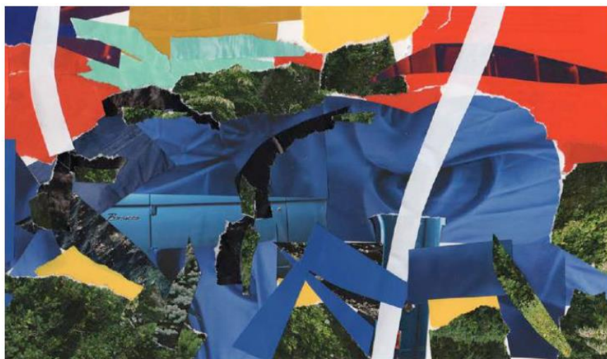
Immagini: (sopra) Franz Marc, Grandi cavalli azzurri, 1911, Olio su tela. (sotto) Collage.